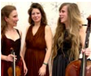
Wienertrioen spiller til nytårsgallafesten

julemarkedet den 1. december, hvor man kan købe julegaver i de mange boder med spændende kunsthåndværk m.v. Julemarkedet åbner kl. 11 og er fuld af hygge. Kl. 15.30 er der fakkeltog ned til kirken, hvor hele Nødebos juletræ tændes kl. 16. Der er juletræsfest for børn og deres voksne søndag den 8. december.