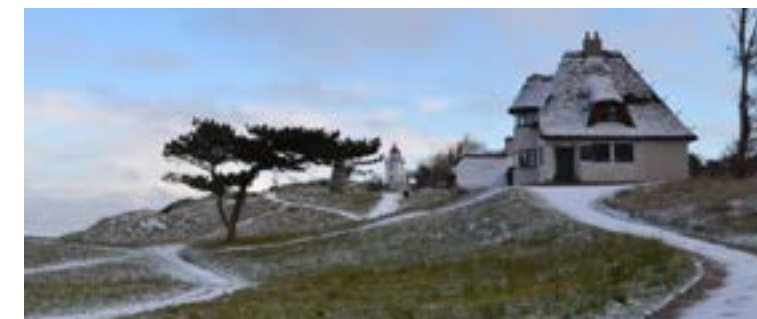
Knud Rasmussens Hus i sne.